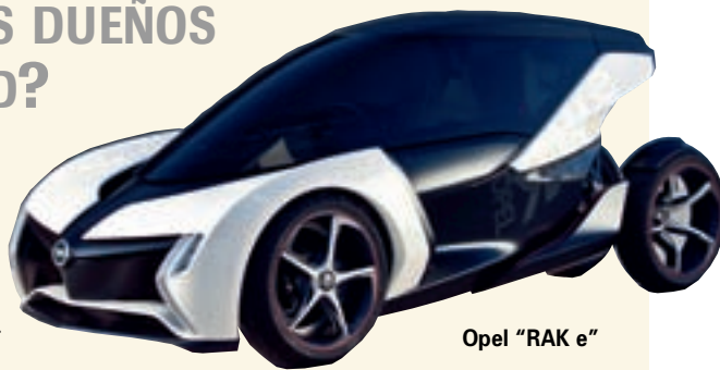
Opel "RAK e"

El concepto de movilidad urbana es indudable que está cambiando y los fabricantes lo saben. Si Renault abrió camino con la presentación de su "Twizy" (ver amplio reportaje en nuestro nº 209), el resto de las marcas no se queda atrás y ya están presentando sus propuestas. Dos son las características que les unen: son eléctricos y muy pequeños. Desde el Audi "Urban Concept", un biplaza con carrocería de fibra de carbono y baterías de litio que le permiten una autonomía de 73 kilómetros, al Volkswagen "Nils", de aluminio, con una sola plaza y 65 kilómetros de autonomía, pasando por el Opel "RAK e", que acoge dos ocupantes y promete recorrer 100 kilómetros por solo un euro. Su carrocería es de material sintético totalmente reciclable.