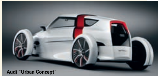
Audi "Urban Concept"